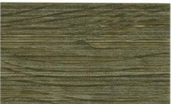
1821* (51 Grön Umbra)