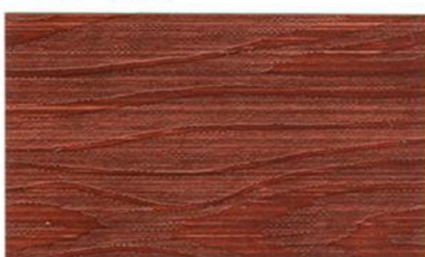
1816* (53 Svenskröd)