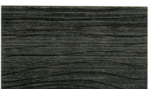
1836* (44 Ebenholz)

Tämän kartan värimallit näyttävät puunsuojan värin kahteen kertaan siveltyinä. Maalattavan kohteen väri saattaa kuitenkin erota huomattavasti värimallien sävystä maalattavan puun karkeuden, laadun ja huokoisuuden vaikutuksesta. Sivele kuultavaa puunsuojaa yhtäjaksoisesti koko hirren tai laudan pituudelta, etteivät jatkoskohdat jää näkyviin.