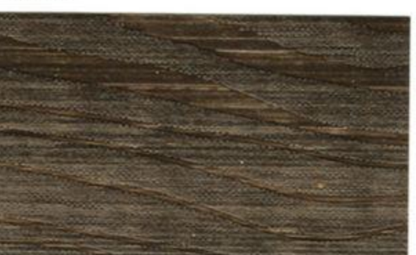
1830* (E-144 Tjärbrun)