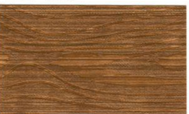
1810* (32 Valnöt)