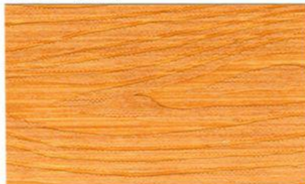
1808* (41 Pine)