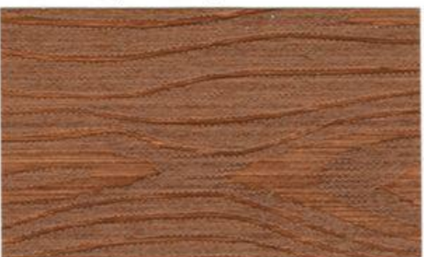
1811* (31 Teak)