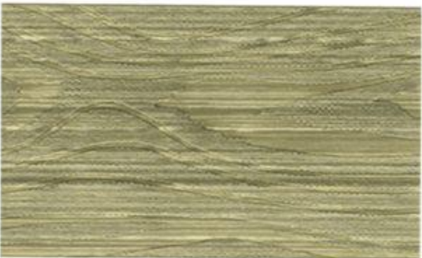
1820* (38 Tryckimp.grön)